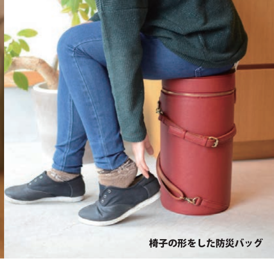
椅子の形をした防災バッグ