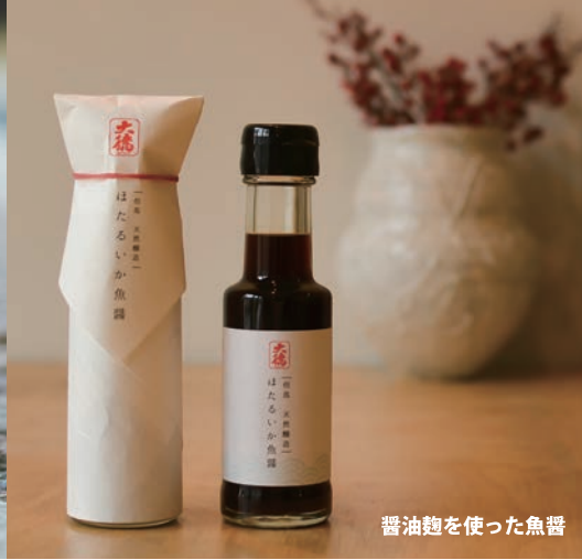
醤油麴を使った魚醤