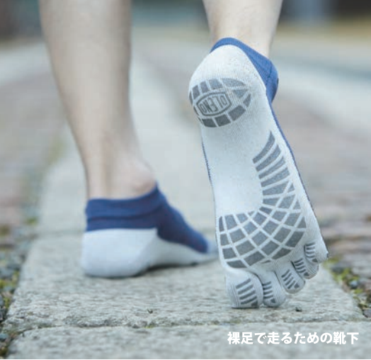
裸足で走るための靴下