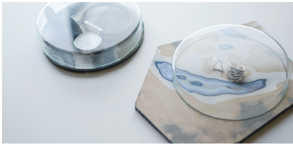
染色工場から出た端布を固めてインテリア商品にした例

ディレクター統括のもと、経営戦略にデザインの視点を取り入れるプロセスを体験する実践型事業です。マッチングされたデザイナーによる企業訪問やヒアリングを通して、デザインを活用した中期経営計画やオリエンテーションシートを作成します。最終的に企業に必要な分野にデザインを取り入れ、企業の強みを伸ばすことを目指します。