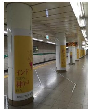
<昨年度の様子・地下鉄三宮駅西行きホーム>