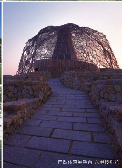
自然体感展望台 六甲枝垂れ