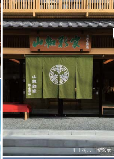
川上商店 山椒彩家