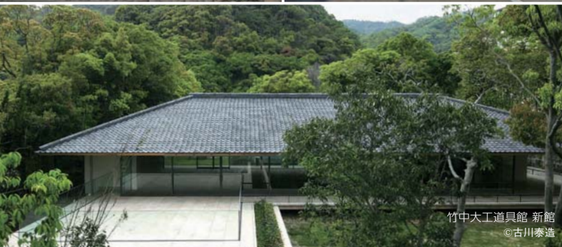
竹中大工道具館 新館