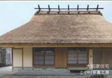
大前家住宅