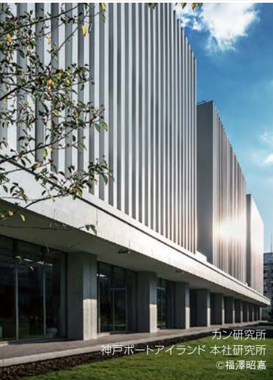
カン研究所 神戸ポートアイランド 本社研究所