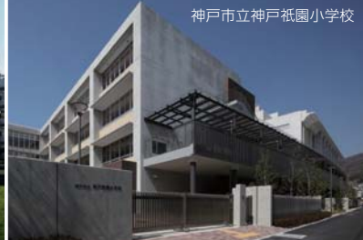
神戸市立神戸祇園小学校