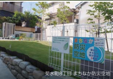
菊水町8丁目 まちなか防災空地