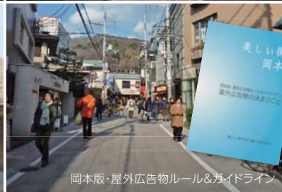
岡本版・屋外広告物ルール&ガイドライン